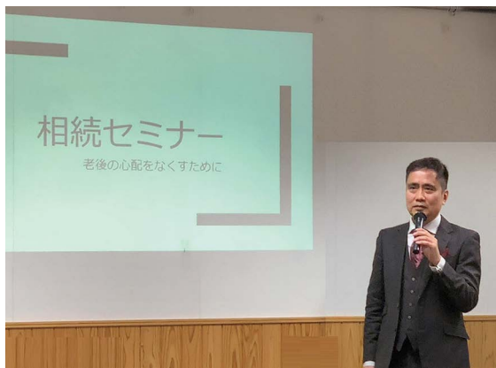
▲毎回好評の相続セミナーの様子。