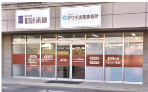
◀兵庫北ゆめタウン近くの1階事務所です。事務所入り口前に専用駐車場完備。